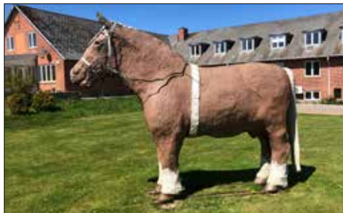
En solid, jysk arbejdshest markerer højrefløjens på Peterspladsen.