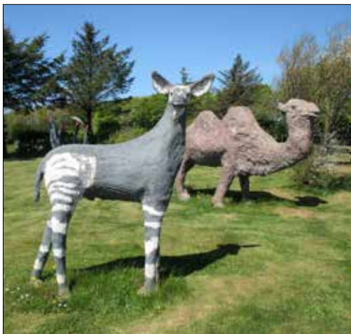
Okapien lever i regnskoven i det centrale Afrika, men et enkelt eksemplar kan også træffes i Bjergby, her med en kamel som makker.