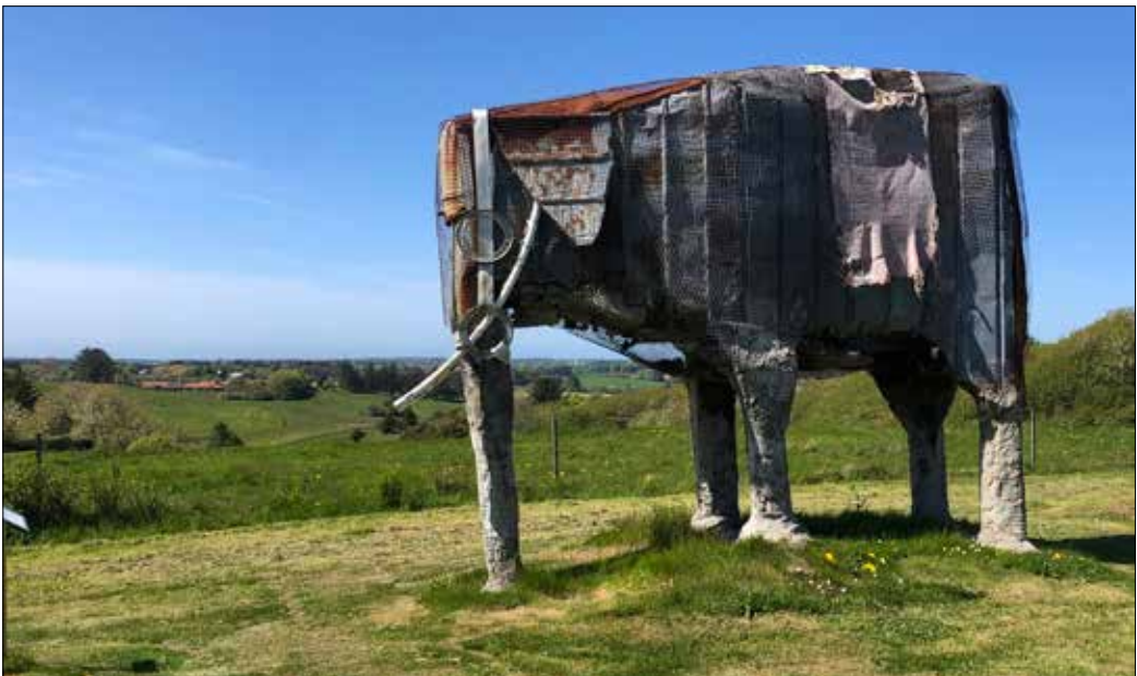
Elefanten har en imponerende udsigt over Bjergby, men trænger snart til en kalfatring (Foto: Hans Nielsen).

Peters første bil var en Hillman med rattet i højre side. Når han skulle ind i sin egen indkørsel, holdt han først ind til højre på vejen, stod ud af bilen, kiggede sig grun-