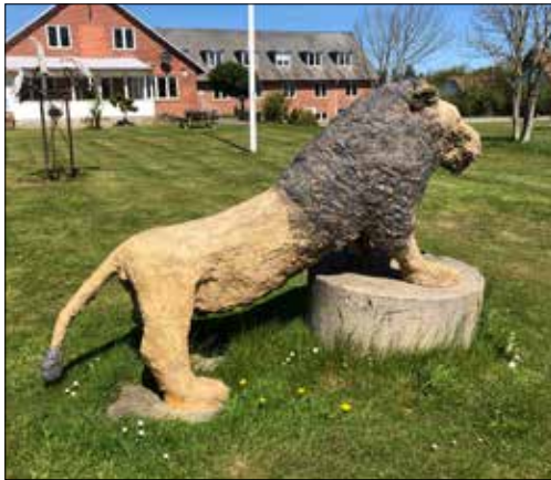
Løven, dyrenes konge, poserer foran Solhjem (Foto: Hans Nielsen).

Sæder fra de gamle biler blev genbrugt som stuemøbler. Ure blev opkøbt på løøreauktion og bygget ind i kasser for derefter at kaldes Bornholmerure.