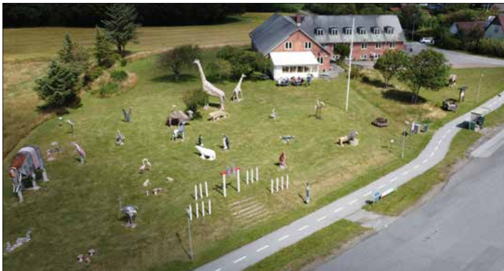
Peterspladsen i Bjergby med et myldrende dyreliv (Foto: Daniel Bylund, 2020).

På en græsplæne ved siden af skuer en jysk arbejdshest ud over landskabet. Inde i aktivitetshuset er væggene smykket med talrige malerier og tegninger lavet af Sme' Peter.